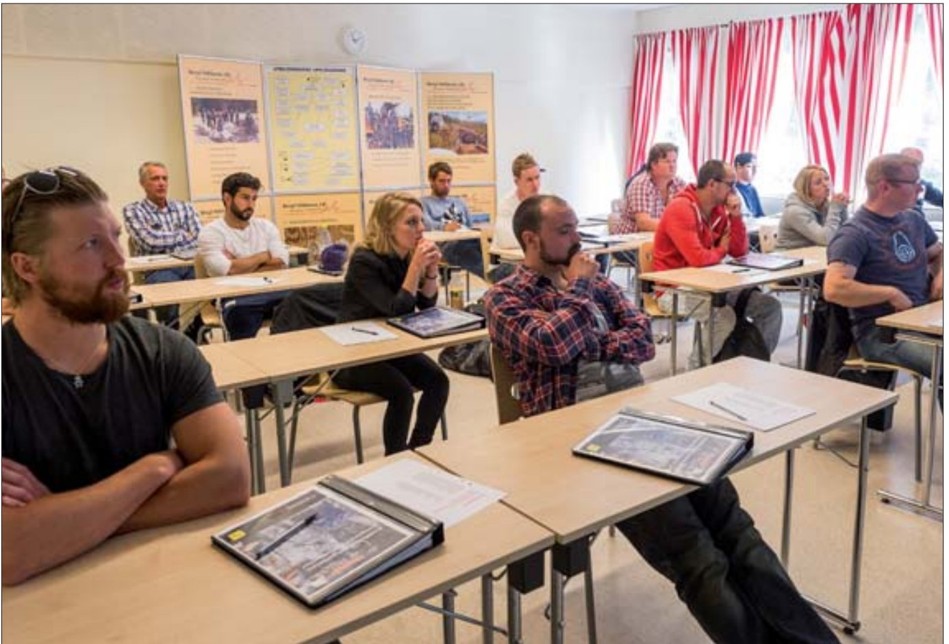
Utbildningen är till hundra procent lärar- eller instruktörsledd.

► hänsyn till detta är arrangören mycket beroende av sponsring från branschen när det gäller material och utrustningar för att utbildningen ska kunna genomföras som planerat.